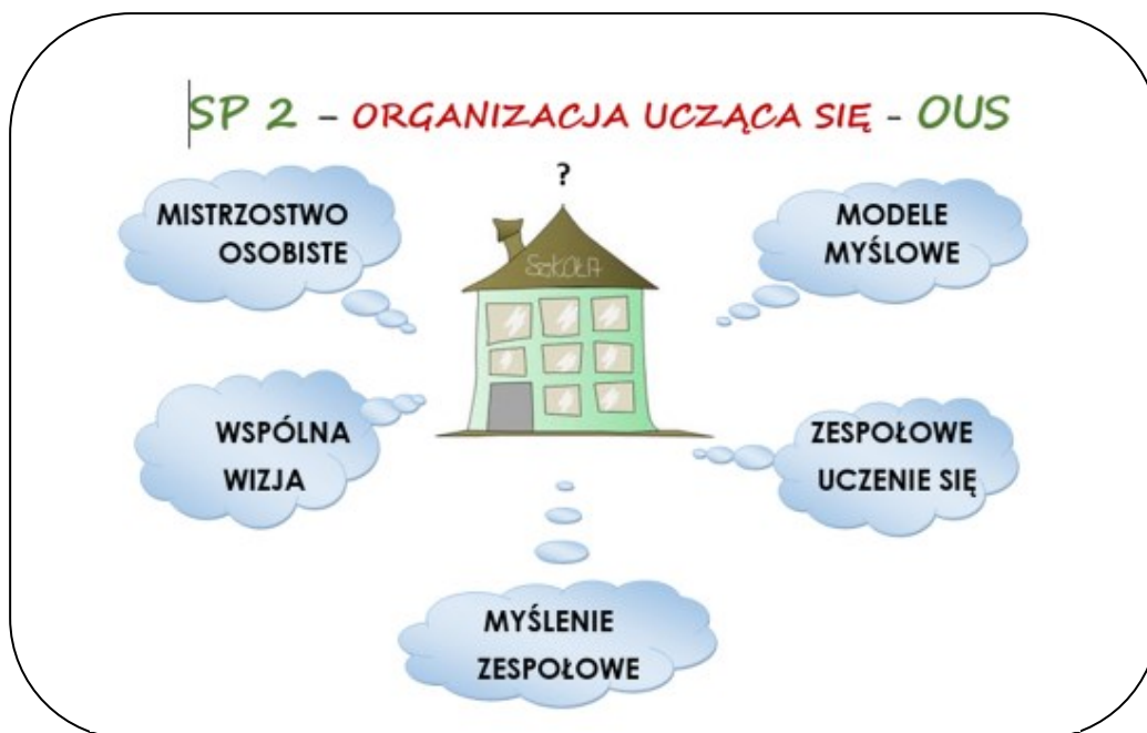
Grafika 2 – OUS (opracowanie własne)

Jesteśmy otwarci na zmiany. Inspiracje do planowania i realizacji zadań czerpiemy z idei, założeń „Organizacji uczącej się” – OUS (Peter Michael Senge), w której wyróżnia się pięć podstawowych dyscyplin: